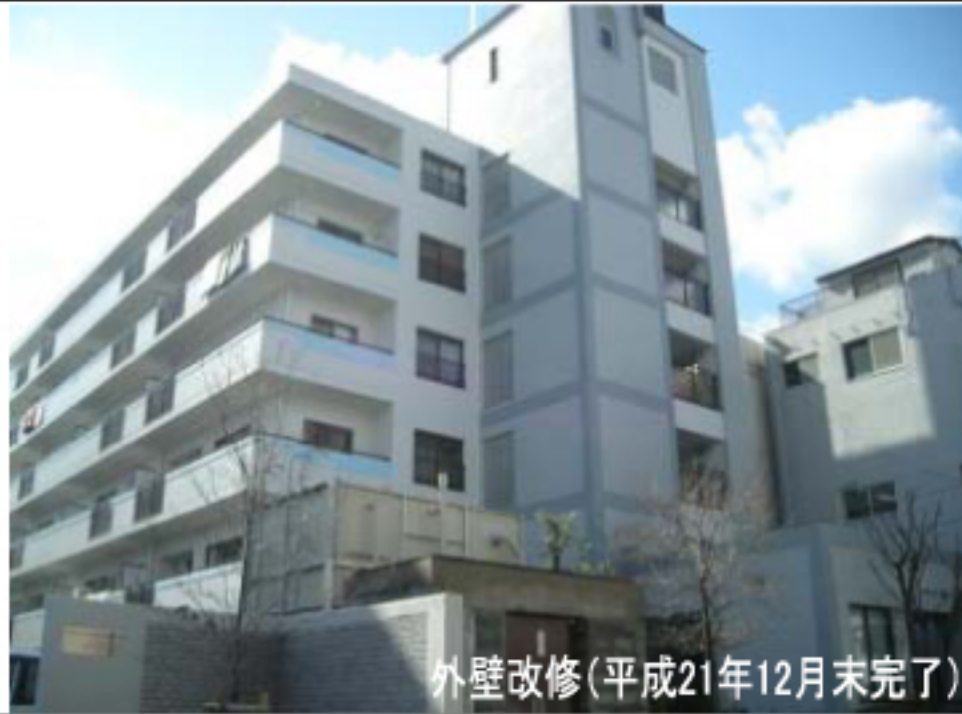
外壁改修(平成21年12月末完了)